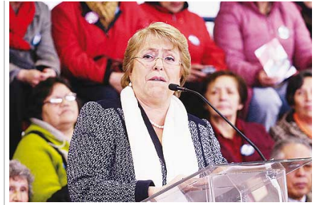
El pueblo los juzgará