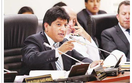
Satélite contra narcos